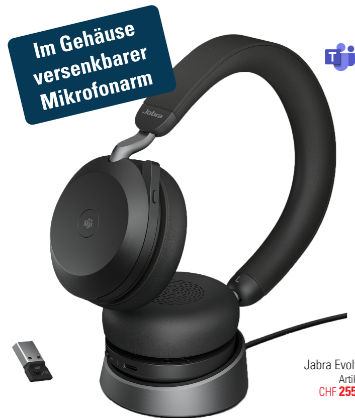
Jabra Evolve2 75 MS USB-A Artikel-Nr.: 27599-999-989 CHF 255.78 (UVP CHF 406.00)

Manchmal müssen Sie auch in schwierigen Umgebungen Anrufe entgegennehmen oder konzentriert arbeiten können. Dank dem individuell einstellbaren Jabra Advanced Active Noise Cancellation (ANC) TM können Sie überall optimal arbeiten.