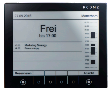
Experience ROOMZ Box Black Artikel-Nr.: ROOMZ-EXP-BOX-B CHF 549.00 (UVP CHF 549.00)

Sofort nach der einfachen Installation werden Sie Ihre Räume effizienter nutzen können. Mit der richtigen Information am richtigen Ort spart Ihnen ROOMZ von nun an die Raserei in den Korridoren. Über ein Touch Panel stehen einfache Funktionen zur Verfügung, welche Sie für jedes Display selbst konfigurieren, buchen und freigeben können.