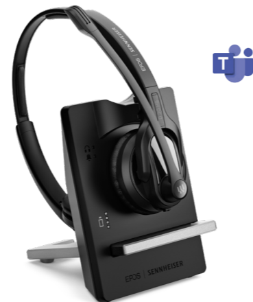
EPOS | Sennheiser D IMPACT 30 Artikel-Nr.: 1000991 CHF 155.61 (UVP CHF 302.00)