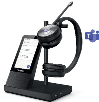
Yealink WH66 MS Stereo Artikel-Nr.: 1308003 CHF 194.67 (UVP CHF 309.00)

Das Yealink WH66 Duo ist ein schnurloses DECT-Headset, das für Microsoft Teams zertifiziert ist. Mehr als ein Headset, es ist eine echte Workstation. Ihre DECT-Basisstation verfügt über einen 4-Zoll-Farb-Touchscreen zur besseren Anrufsteuerung, eine integrierte Freisprecheinrichtung und einen 2-Port-USB-Hub. Das optionale kabellose Smartphone-Ladegerät (Yealink WHC60) vervollständigt die Workstation.