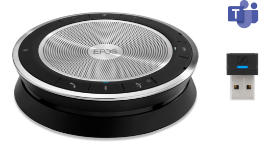
EPOS EXPAND SP 30T Artikel-Nr.: 1000225 CHF 165.69 (UVP CHF 263.00)

Mobiles, kabelloses Bluetooth-Speakerphone mit perfekter Audio-Performance. Unterstützt Einzel- bis mittelgrosse Telefonkonferenzen mit bis zu 8 Personen. Zertifiziert für Microsoft Teams. Inkl. Bluetooth USB-Dongle.