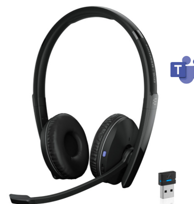
EPOS | Sennheiser ADAPT 260 Artikel-Nr.: 1000882 CHF 110.25 (UVP CHF 175.00)

Ohraufliegendes, zweiseitiges Bluetooth-Headset mit USB-Dongle, UC-optimiert und für Microsoft Teams zertifiziert. Wenn Sie im Job Anrufe über mehrere Geräte abwickeln müssen, brauchen Sie ein kabelloses Headset, das sich in Ihre dynamische, hybride Arbeitsweise einfügt.