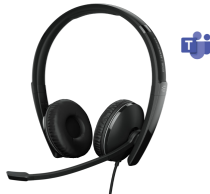
EPOS | SENNHEISER ADAPT 160 Artikel-Nr.: 1000219 CHF 96.39 (UVP CHF 153.00)

Arbeiten. Hier und überall, mit einem stilvollen, komfortablen Headset für die Anforderungen des heutigen hybriden Arbeitsplatzes mit ANC und herausragendem Stereosound. Geniessen Sie eine Audiolösung, die sich nahtlos im Büro, unterwegs oder im Homeoffice anpasst.