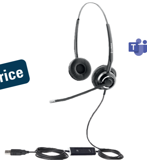
freeVoice SoundPro 412 UC MS Artikel-Nr.: FSP412UCB CHF 39.69 (UVP CHF 63.00)