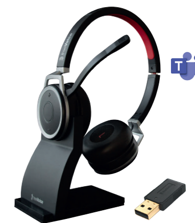
freeVoice Space Stereo NC Artikel-Nr.: FBT650BTS CHF 125.37 (UVP CHF 199.00)