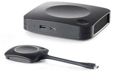
Barco ClickShare CX-20 Artikel-Nr.: R9861512EU CHF 1'951.95 (UVP CHF 2'145.00)

Die moderne Unternehmenswelt erfordert reibungslose Zusammenarbeit und Flexibilität, insbesondere in Bezug auf Teammeetings in kleinen Besprechungsräumen und genau dies gewährleistet ClickShare CX-20 von Barco. ClickShare CX-20 fördert kreative Innovationen durch nahtlose drahtlose Konferenzen und kann Meetings anregender und produktiver gestalten.