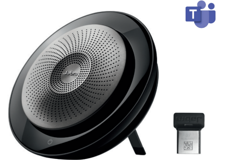
Jabra Speak 710 MS Artikel-Nr.: 7710-309 CHF 190.89 (UVP CHF 303.00)

Geniessen Sie die hochwertige Klangqualität des Jabra Speak 710 Lautsprechers. Die integrierte DSP-Technologie (Digital Signal Processing) garantiert einen klaren Ton ohne Echos, und das omni-direktionale Mikrofon garantiert eine ideale Sprachübertragung. Intuitiv und einfach zu bedienen, keine Einweisung erforderlich.