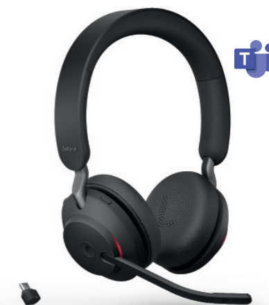
Jabra Evolve2 65 MS USB-C Artikel-Nr.: 26599-999-899 CHF 144.90 (UVP CHF 230.00)

Weitere Jabra Evolve2 65 Headsets ab CHF 137.97 (UVP CHF 219.00)