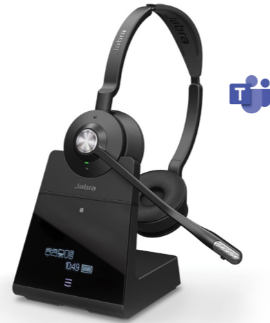
Jabra Engage 75 Artikel-Nr.: 9559-583-111 CHF 276.57 (UVP CHF 439.00)

Bietet überragende, schnurlose Konnektivität mit einer Reichweite von bis zu 150 Meter. Damit können dreimal mehr Nutzer im selben Büro telefonieren - ohne Einbussen bei der Verbindungsqualität. Verbinden Sie bis zu fünf Geräte gleichzeitig: Tischtelefon, Softphone, analogem Festnetztelefon und zwei Bluetooth-fähigen Endgeräten.