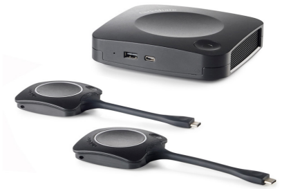
Barco ClickShare CX-30 Artikel-Nr.: R9861513EU CHF 2'411.50 (UVP CHF 2'650.00)

Damit Meetings so produktiv wie möglich sein können, müssen sich die Teilnehmer eingebunden und inspiriert fühlen. ClickShare CX-30 von Barco bietet eine nahtlose Drahtloskonferenz-Lösung für Geräte aller Art, um Teilnehmern an Standorten überall auf der Welt die Teilnahme an Meetings zu ermöglichen und somit die besten Ideen und Diskussionspunkte zu schaffen.