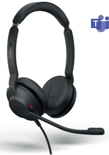
Jabra Evolve2 30 MS USB-A Artikel-Nr.: 23089-999-979 CHF 61.74 (UVP CHF 98.00)

Weitere Jabra Evolve2 30 Headsets ab CHF 59.15 (UVP CHF 91.00)