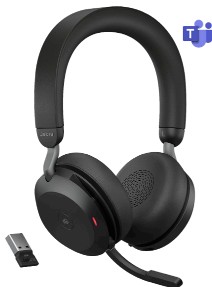
Jabra Evolve2 75 MS USB-A Artikel-Nr.: 27599-999-999 CHF 228.06 (UVP CHF 362.00)