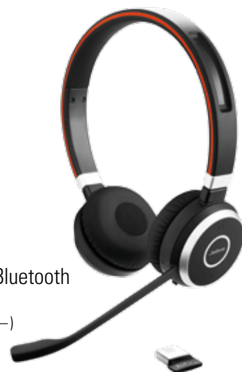
Jabra Evolve 65 Duo NC Bluetooth 6599-829-409 CHF 145.60 (UVP CHF 182.–)