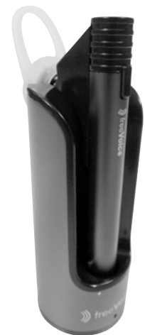
Bluetooth Headset freeVoice Tube