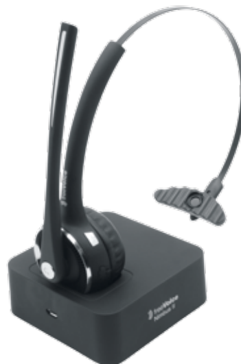
Bluetooth Headset freeVoice Nimbus II

Apple nimmt hier den Trend wieder einmal vorne weg und verzichtet im neuen iPhone schlicht auf einen Kopfhöreranschluss. Die Verbindung zum Headset soll über Bluetooth laufen. Zugegeben, verkabelte Menschen sehen nicht gerade attraktiv aus. Mit den freeVoice Headsets sind Sie bereits einen Schritt voraus und für die Zukunft bestens gerüstet.