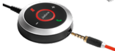
Jabra Evolve 40 Mono 6393-823-109 CHF 78.40 (UVP CHF 98.–)