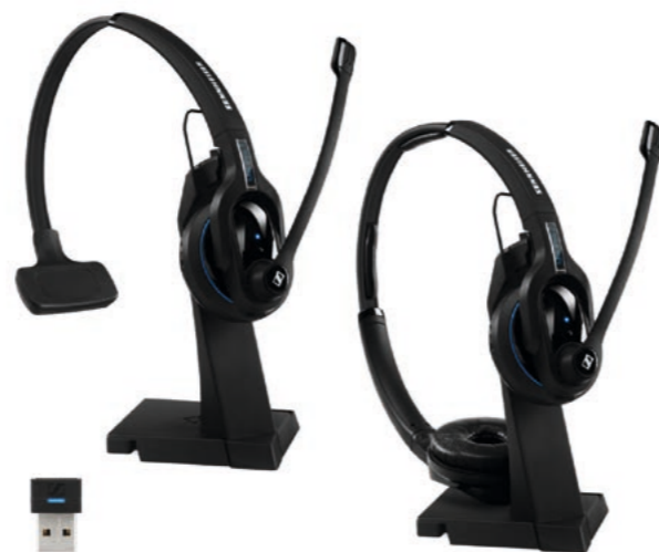
MB Pro 1 UC Mono 506042 PVR CHF 232.00