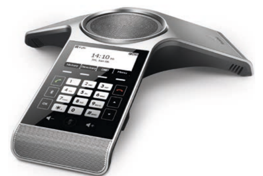
Yealink CP920 SIP SIP-CP920