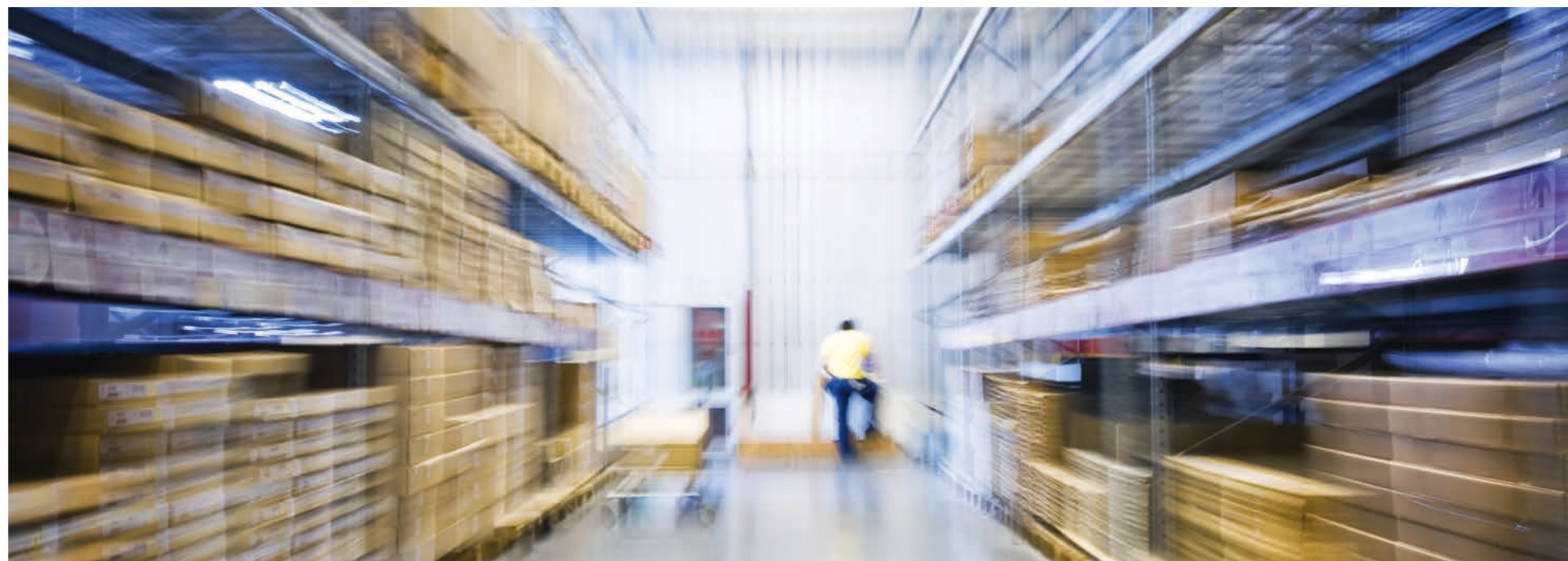
Max Egger CEO Suprag AG

Le numérique, c'est bien joli, mais cela coïncide la plupart du temps là où il y a des points de transfert, chez nous par exemple sur la table de conditionnement, où les micros-casques et les accessoires sont emballés avant d'être déposés à la poste. Pour que les flux des marchandises et les chaînes des valeurs fonctionnent de manière optimale, les mouvements d'entrée et de sortie des produits dans l'entrepôt doivent fonctionner de manière optimale.