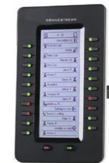
Grandstream GXP2200EXT Module d'extension GXP2200EXT CHF 126.55 (PVR CHF 149.-)