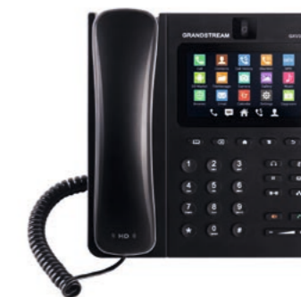
Grandstream IP Video Phone with Android GXV3240 CHF 203.15 (PVR CHF 239.-)