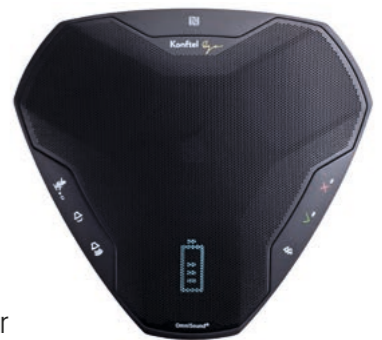
Konftel Ego USB-Haut-Parleur