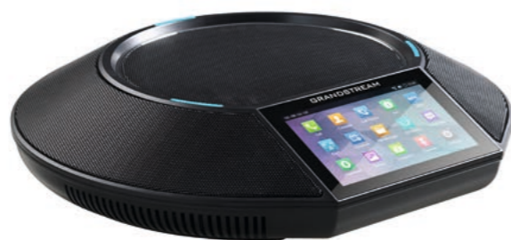
Grandstream Android-Téléphone de conférence GAC2500 CHF 398.65 (PVR CHF 469.-)