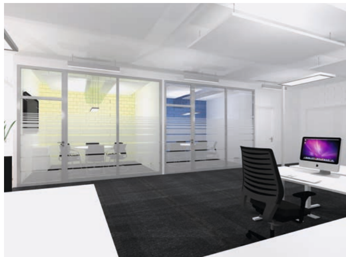
Petite salle de réunion