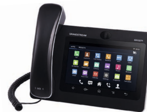
Grandstream IP Video Phone with Android GXV3275 CHF 279.65 (PVR CHF 329.-)