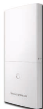
Grandstream long-range wireless access point GWN7600LR CHF 116.00 (PVR CHF 145.-)