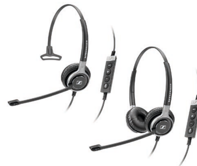
SC 630 USB CTRL Mono 504554 PVR CHF 189.00