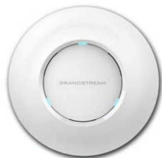
Grandstream high-performance wireless access point GWN7610 CHF 108.00 (PVR CHF 135.-)