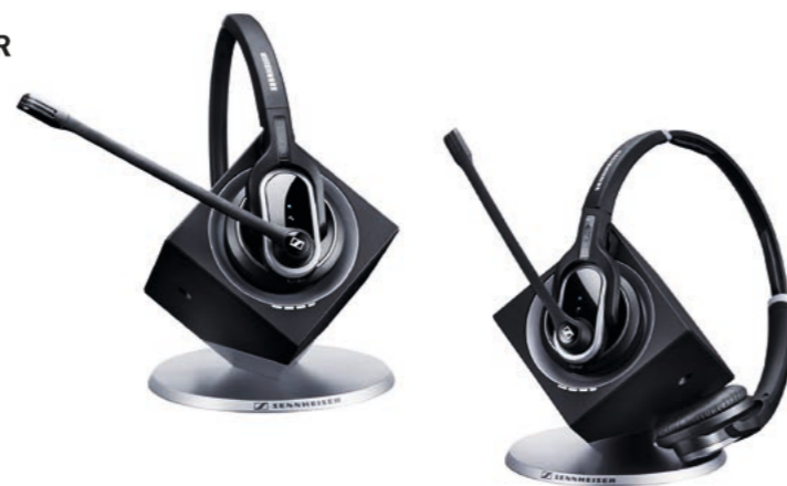
DW20 Pro 1 Mono 504304 PVR CHF 371.00